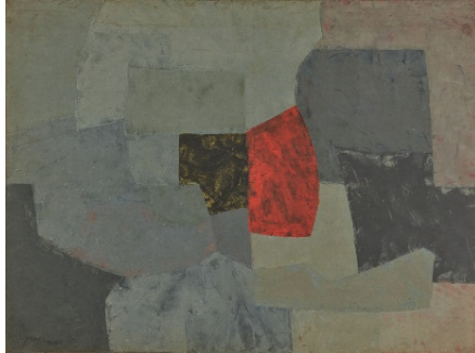
Serge Poliakoff (1900 – 1969) Composition grise | 1956 Öl auf Leinwand | 97 x 130 cm Ergebnis: € 251.000