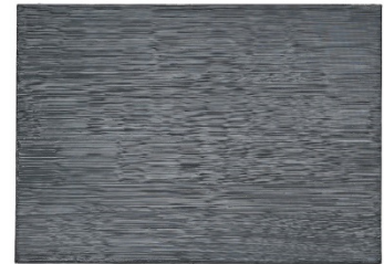
Gerhard Richter (1932) Grau | 1973 | Öl auf Leinwand | 50 x 70,4 cm Ergebnis: € 257.500