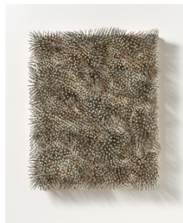
Günther Uecker (1930) „Weisser Wind“ | 1990 | Nägel und weiße Farbe auf Leinwand auf Holz | 110 x 90 x 17,5 cm Ergebnis: € 475.000