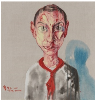
Zeng Fanzhi (1964) Untitled #9 | 2001 | Öl auf Leinwand | 70 x 70 cm Ergebnis: € 244.000 Dt. Auktionsrekord für diesen Künstler*