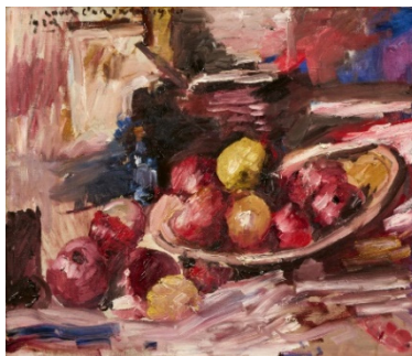
Lovis Corinth (1858 – 1925) Apfelstillleben | 1920 Öl auf Leinwand | 56 x 66 cm Ergebnis: € 224.500