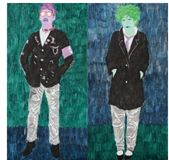
Kiki Kogelnik (1935 – 1997) "Real Life Stinks" (I + II) | Diptychon | 1979 Öl und Sicherheitsnadeln auf Leinwand Gesamtmaß: 195 x 200 cm Ergebnis: € 185.000 Dt. Auktionsrekord für diese Künstlerin*

Alle Preise sind gerundet und beinhalten das Aufgeld *Auktionsrekorde laut Artprice.com – Stand 6. Juni 2024 (ohne Gewähr)