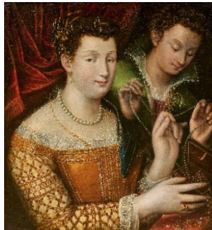
Lavinia Fontana (1552 – 1614) Die Schmuck-Wahl | Öl auf Leinwand | 69,7 x 66 cm Ergebnis: € 607.000