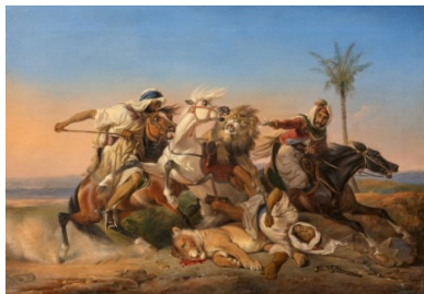
Raden Saleh Ben Jaggia (1811 – 1880) Kampf zwischen arabischen Reitern und einem Löwen | Öl auf Leinwand | 67 x 98 cm Ergebnis: € 726.000