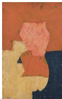
Serge Poliakoff (1900 – 1969) Composition | 1951/1954 Öl auf Leinwand | 100 x 65 cm Ergebnis: € 462.000