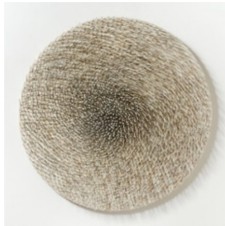
Günther Uecker (1930) „Lichtscheibe“ | 1998 | Nägel, weiße Farbe auf Leinwand auf Holz | Ø 150 x 7 cm Ergebnis: € 898.000