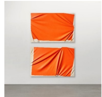
Steven Parrino (1958 – 2004) „Lucifer's Hammer“ | 1989 | Diptychon Emaillack auf Leinwand | Je 123 x 183cm Ergebnis: € 528.000