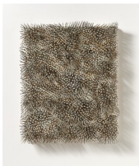
Günther Uecker (1930) „Weisser Wind“ | 1990 | Nägel und weiße Farbe auf Leinwand auf Holz 110 x 90 x 17,5 cm Ergebnis: € 475.000