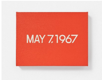
On Kawara (1932 – 2014) „MAY 7, 1967“ | 1967 Acryl auf Leinwand | 33,5 x 44 cm Ergebnis: € 1.056.000 Int. Auktionsrekord für ein Date Painting in diesem Format**